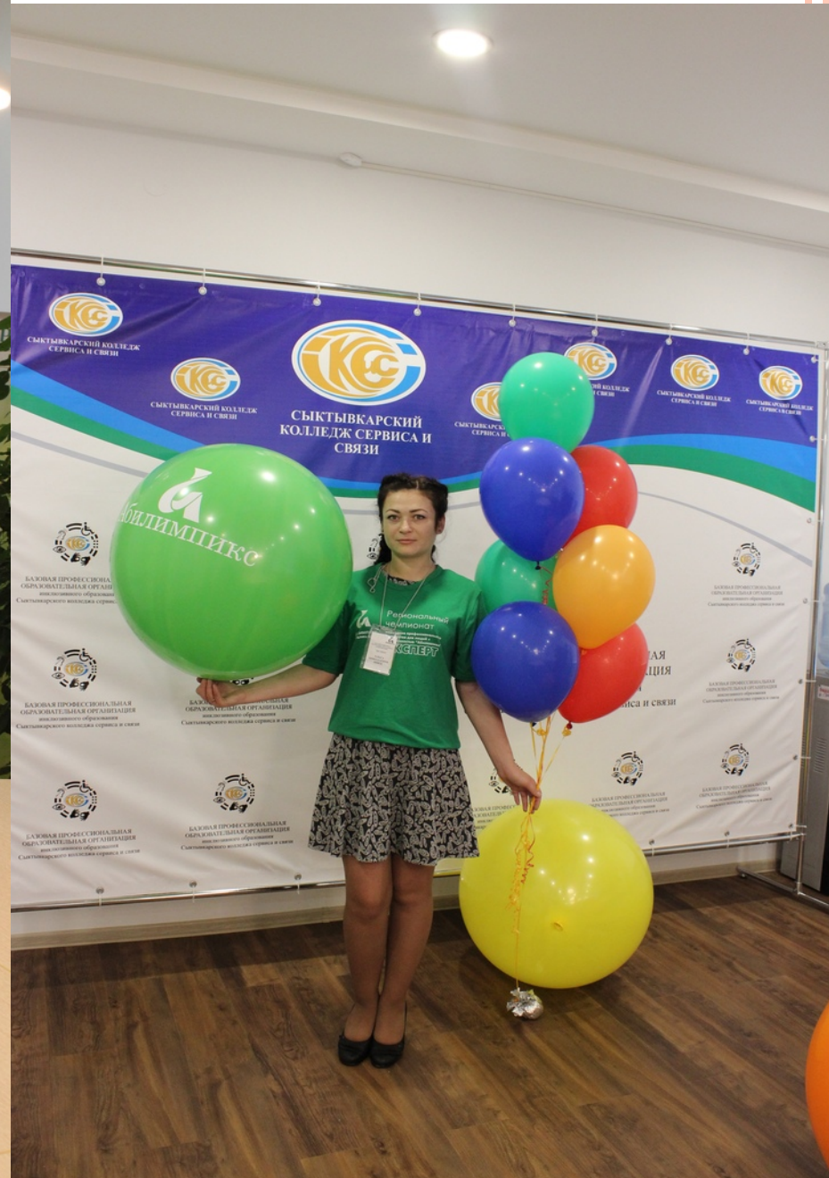
Эксперт, г. Усинск, ГПОУ «УПТ»