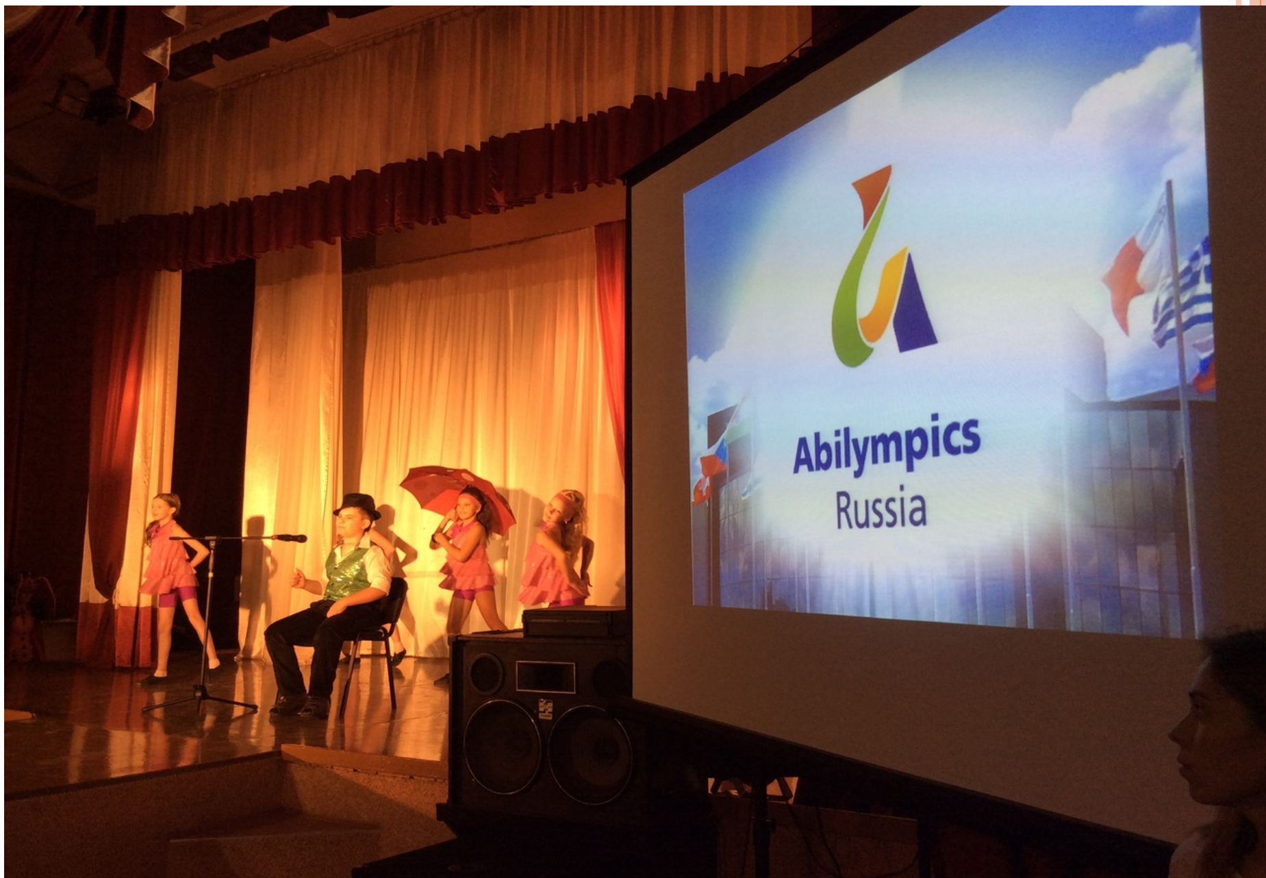
Церемония открытия Регионального чемпионата